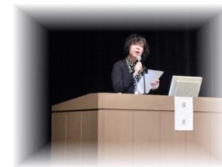
2018.11.17 奈良で開催された TGCV講演会にて